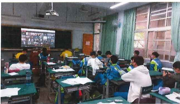
文字說明：講者們分享自我生涯經歷