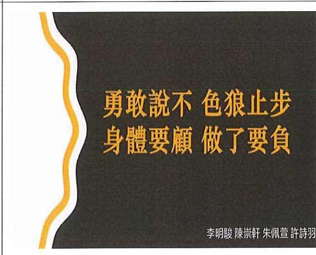
健康護理科學生倡議作品 2