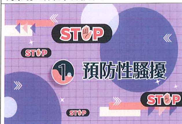
健康護理科教學投影片 3