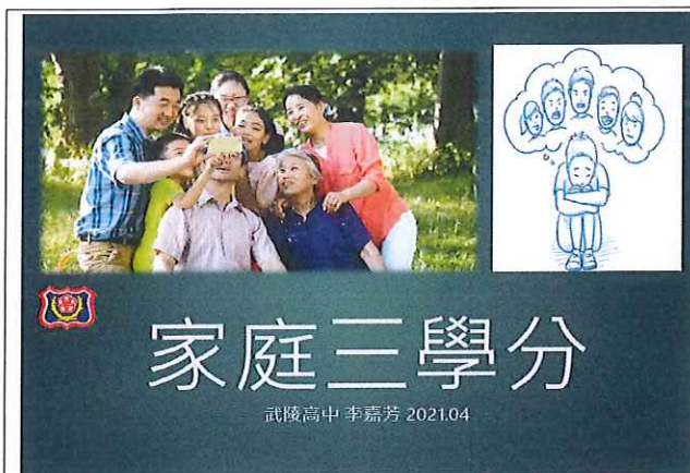
家政科課程投影片 1