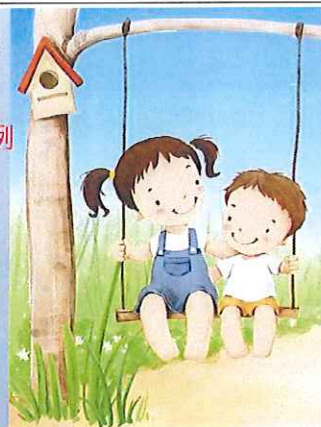
家政科課程投影片 2