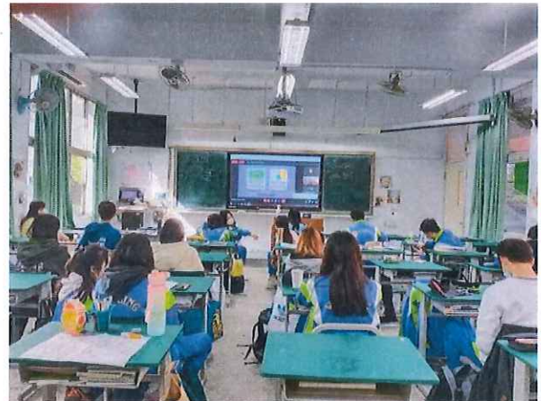
文字說明：學生 QA 問答回覆