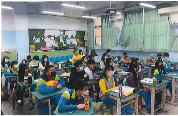
文字說明：學生專心觀看講者分享影片