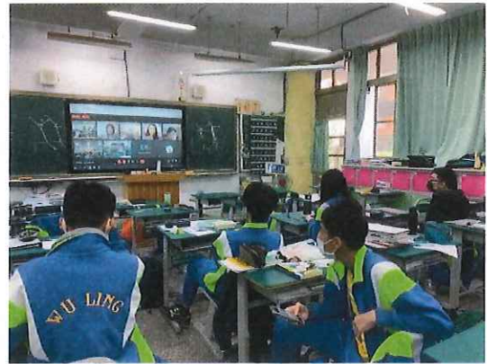
文字說明：講者分享多元性別在職涯上的可能性