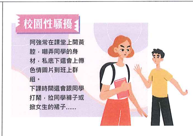
健康護理科教學投影片 2