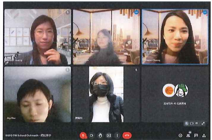
文字說明：講者與學生的 QA 時間