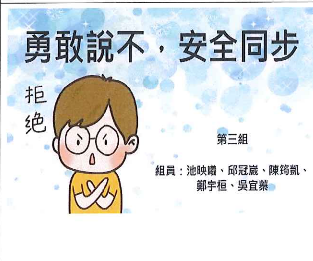
健康護理科學生倡議作品 1