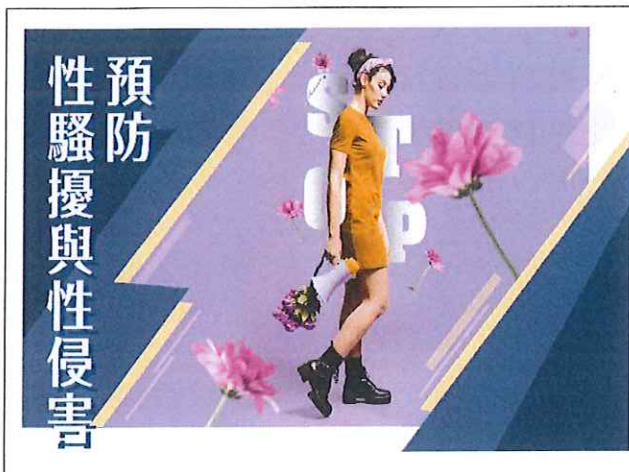
健康護理科教學投影片 1