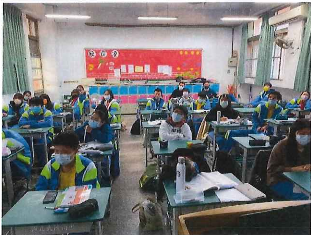
文字說明：講者針對學生問題回覆