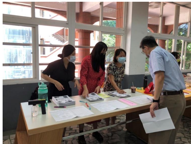
▲報到處簽到與領取會議資料（上圖）