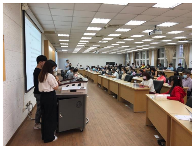
▲議場內因應防疫措施採梅花座（下圖）