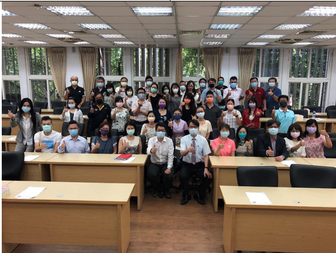
▲校長與家長會家長及所有委員合影